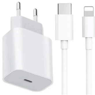
Hleðslutæki og snúra (geta litið öðruvísi út)