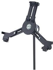
1x Ipad Haldari