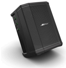
1x Bose S1 Pro Hátalari