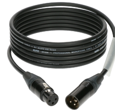
3x XLR Snúrur